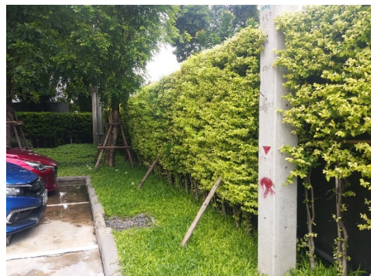
รูปที่ 1-1 สถานภาพของโครงการ ณ เดือนพฤษภาคม พ.ศ. 2565